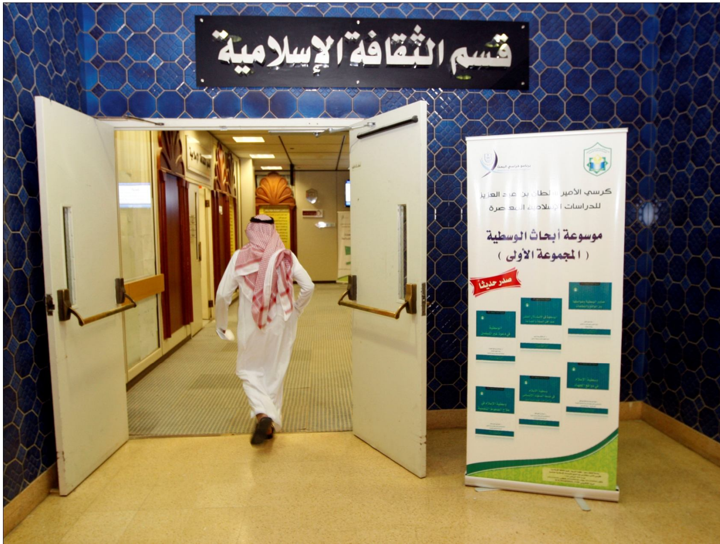
نموذج رقم (٥-١)