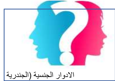
الادوار الجنسية (الجنسانية)