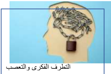
التطرف الفكري والتعصب