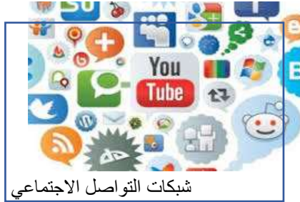
شبكات التواصل الاجتماعي