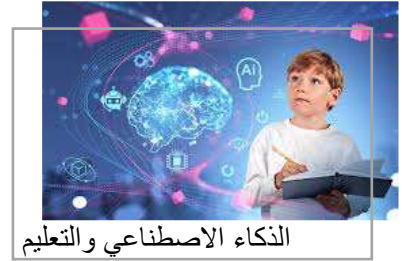
الذكاء الاصطناعي والتعليم