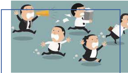
التنمر في العمل، جودة الحياة الوظيفية