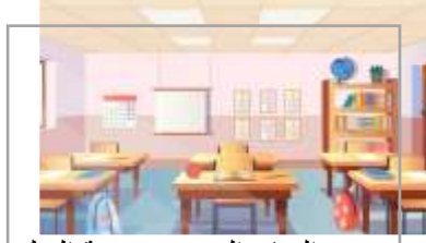
المناخ المدرسي وبيئة التعلم