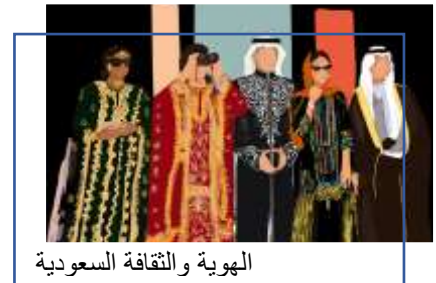
الهوية والثقافة السعودية